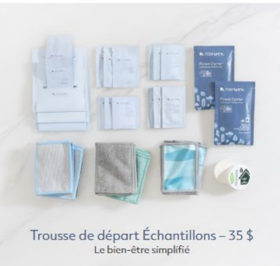
Trousse de départ Échantillons – 35 $ Le bien-être simplifié

Sac de transport pour trousse Formulaires de commande pour clients (20) Formulaires de commande pour hôtesse (hôte) (5) Catalogues d'automne 2025 (10) Cartes de partages Brochure Occasion Norwex Brochure Récompenses Départ brillant Carte de bienvenue