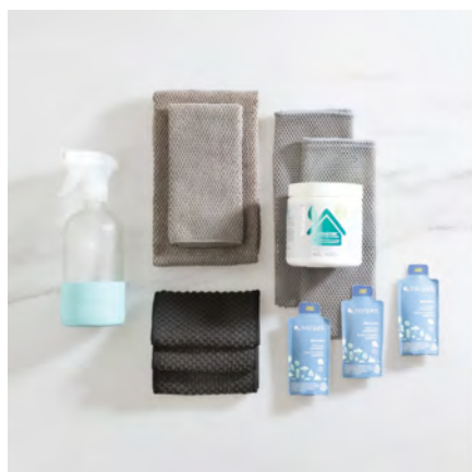
OBJECTIF 1 DU DÉPART BRILLANT

Obtenez une PRIME EN ESPÈCE de 100 $ lorsque vous recrutez 3 nouveaux membres d'équipe qui atteignent leur objectif 1 du Départ brillant dans votre période du Départ brillant.