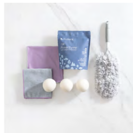
OBJECTIF 3 DU DÉPART BRILLANT

1 de chaque : EnviroCloth® (Linge Enviro), Linge à fenêtre, Nettoyant pour salle de bains, Brosse de toilettes distributrice de nettoyant, Gant pour nettoyer la salle de bains