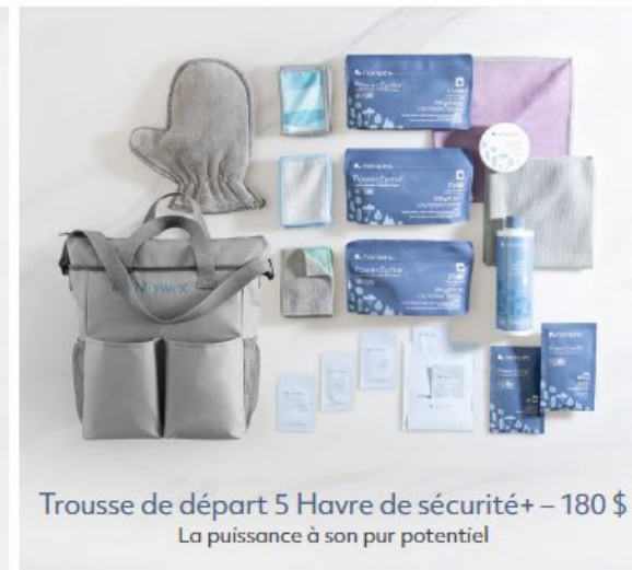
Trousse de départ 5 Havre de sécurité+ – 180 $ La puissance à son pur potentiel

Échantillons de Mini Linge Enviro (10) Échantillons de Mini Linges pour corps et visage (10) Échantillons de Mini Linge à fenêtre (10) Pâte nettoyante puissante, mini (25 ml/0,85 oz.) Catalogue d'automne 2025 (3) Cartes de partage Carte de bienvenue