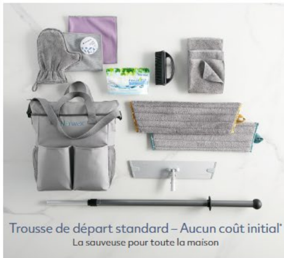
Trousse de départ standard – Aucun coût initial* La sauveuse pour toute la maison

Vous pourriez également recevoir plus de 400 $ de produits GRATUITS grâce à notre programme Départ brillant.